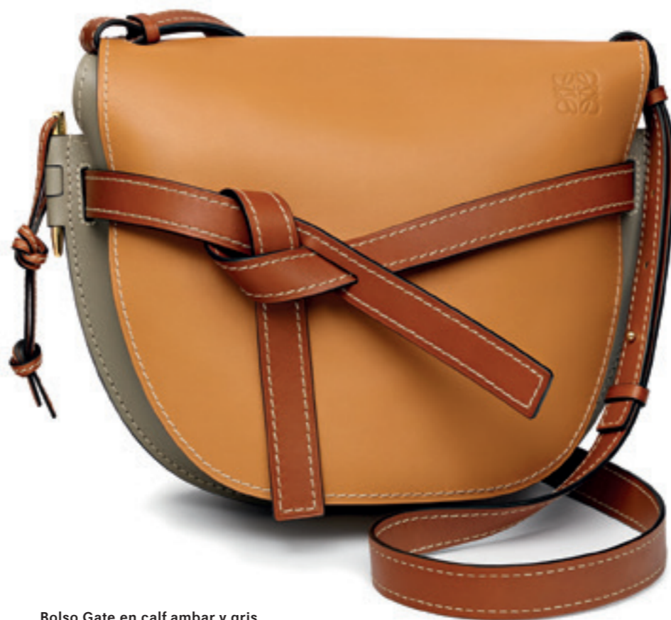
Bolso Gate en calf ambar y gris con strap en caramelo, 2018