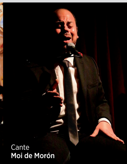
Cante Moi de Morón